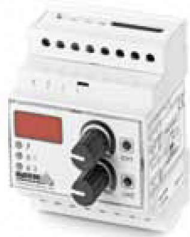
Unidad reguladora digital TR-D