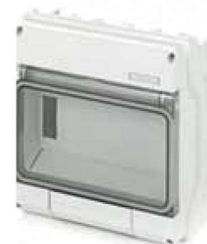
CAJA PROTECTORA PARA TR-A Y TR-D