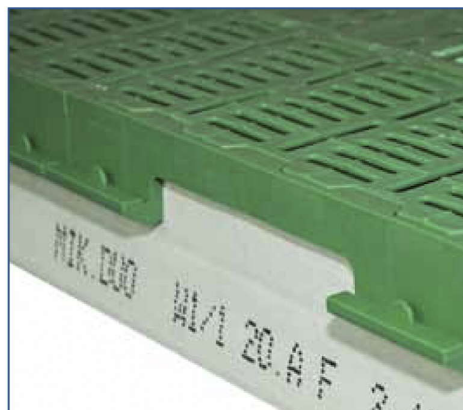
Gancho de instalación: disponible para todos los sistemas MIK y para uso universal