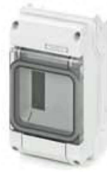
CAJA PROTECTORA PARA TR-A