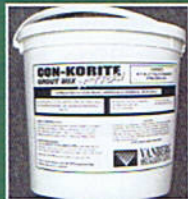
17 Lb. Pail