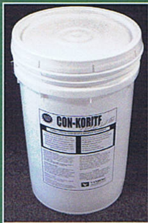
60 Lb. Kit