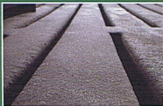
lamas reparadas con ARMOR-ROCK THX