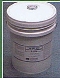
VSC Concrete Clean & Etch 5 Gal. Pail