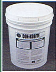
55 Lb. Pail