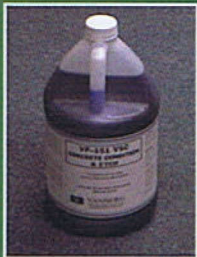
VSC Concrete Clean & Etch 1 Gal. Jug