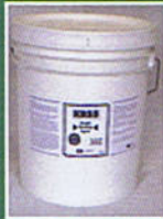
5 Gal. Pail