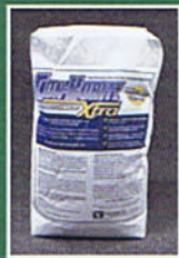
55 Lb. Bag