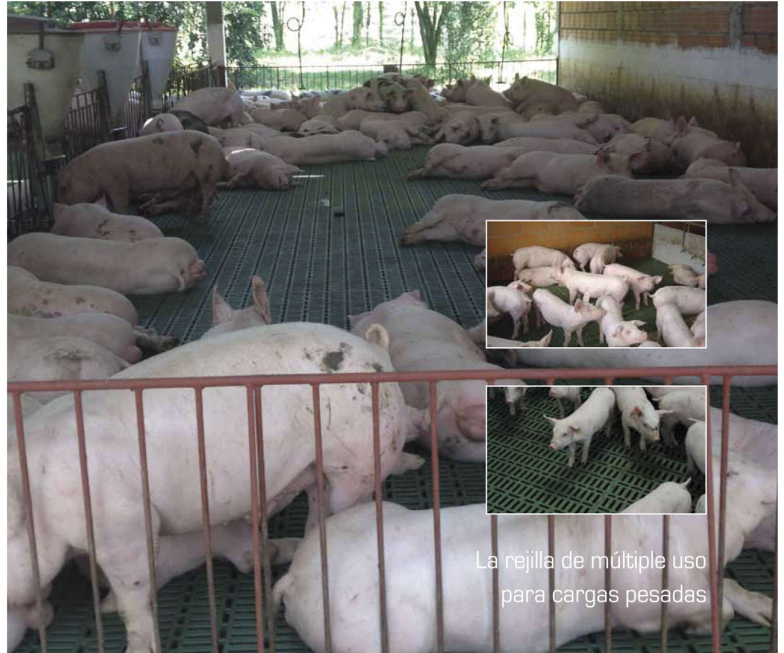
La rejilla de múltiple uso para cargas pesadas