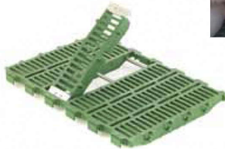
RUBIN Gully Flap Solución higiénica con trampilla de limpieza para ahorro de tiempo al limpiar