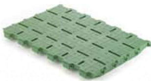
RUBIN G La placa ciega