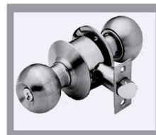
CHAPA CON ACABADO TIPO ACERO INOXIDABLE DE 2 3/4" MOD. BP-106EA