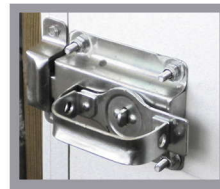
CHAPA GALVANIZADA DE USO RUDO MEDIDAS 4 1/2" X 3 5/8"