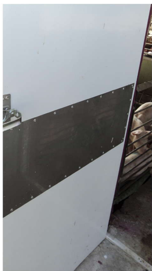
PROTECTOR PARA PUERTA EN LAMINA DE ACERO INOXIDABLE